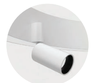
Midpin Spotlight XP 770lm/10W/Ø40mm