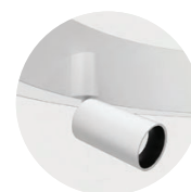
Midpin Spotlight XP 770lm/10W/Ø240mm